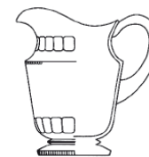
18299 džbán / jug C: 1500 ml / 1.5 qt. H: 21,8 cm / 8.6 inch

VÝŠKA KARAF BEZ ZÁTEK ▪ THE HEIGHT OF DECANTERS WITHOUT STOPPER C: OBSAH (ml), H: VÝŠKA (cm), MĚŘÍTKO 1:10 C: CAPACITY (oz), H: HEIGHT (inch), SCALE 1:10