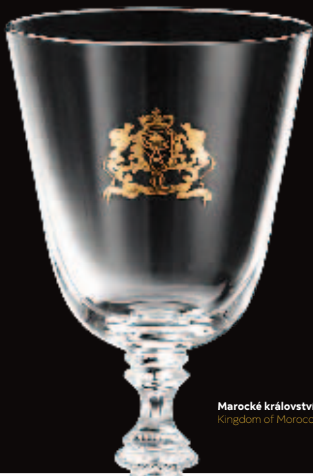
Marocké království Kingdom of Morocco

Maharajah of Hyderabad, India Egyptian King Fuad